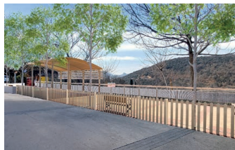
Projecte virtual.

La Junta de Govern Local de l'Ajuntament de la Seu d'Urgell va aprovar en sessió del passat dilluns 13 de maig, de manera inicial, els projectes de rehabilitació de la plaça 'el Rastrillo' de Castellciutat i l'arranjament de la vorera del cinyell verd en el tram que va del pont de la Palanca al rocòdrom del Parc del Segre. Pel que fa al projecte al poble de Castellciutat, té com a finalitat realitzar obres de millora del parc infantil i la plaça del Rastrillo per tal de dotar-hi d'un espai d'ombra que en permeti l'ús a l'estiu, ampliar els jocs per