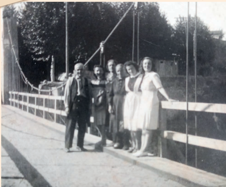
Pont de la Palanca, anys 60